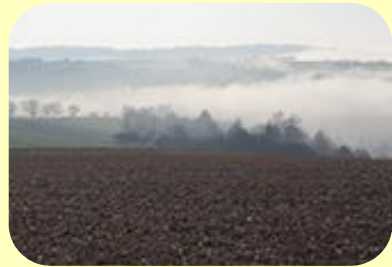
Boden & Grundwasser