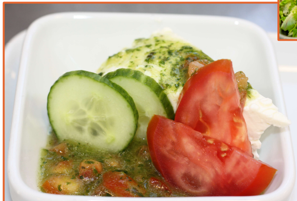
Fertiger Rahmkäse vom Aspichhof