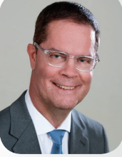
Landrat Toni Huber (CDU)

Landrat Toni Huber ist 1964 in Karlsruhe geboren. Nach dem Studium an der Fachhochschule für öffentliche Verwaltung in Kehl mit dem Abschluss als Diplom-Verwaltungswirt (FH) war er von 1990 bis 1991 Sachgebietsleiter Personal und Organisation der Gemeinde Ubstadt-Weiher und von 1991 bis 1993 Hauptamtsleiter der Gemeinde Forst. 1993 wurde er zum Bürgermeister der Gemeinde Weisenbach gewählt und 2001, 2009 und 2017 für weitere Amtszeiten bestätigt.