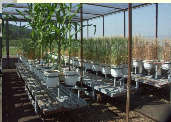
Säulenversuch im Labor (Bild links) und Aufwuchsversuche (Bild rechts)