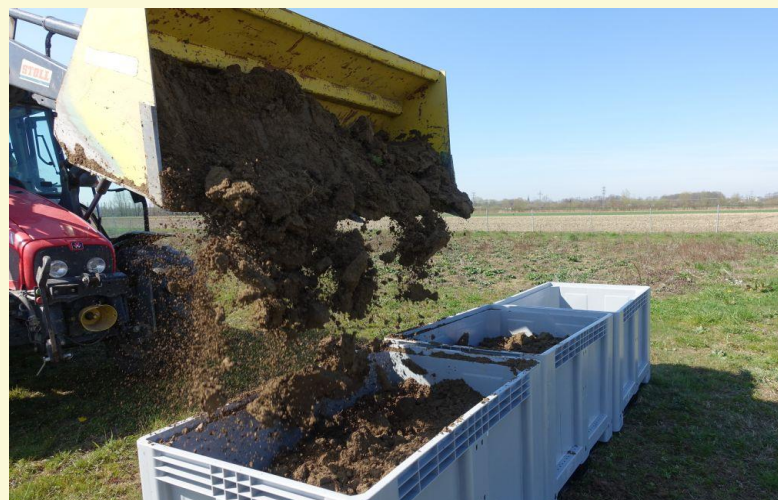
Bodenentnahme aus der Region Rastatt/Baden-Baden ( Bild links ) und Gefäßversuche mit Mais ( Bild rechts )

Auf Basis der in den Labor- und Feldversuchen erhobenen Daten wird ein Simulationsmodell erarbeitet mit dessen Hilfe das Umweltverhalten von PFC analysiert und vorhergesagt werden kann ( Grafik links ). Des Weiteren sollen Transferfaktoren ermittelt und Vorschläge für die Ableitung von Bewertungsmaßstäben (Bodenwerten) gemacht werden. Diese stellen für alle mit PFC kontaminierten Böden ein dringend erforderliches Instrument für den praktischen Vollzug dar.